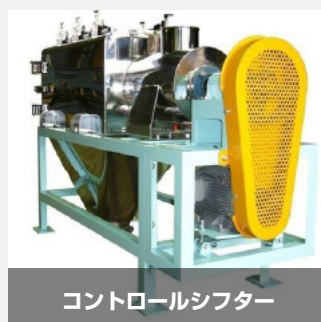
コントロールシフター