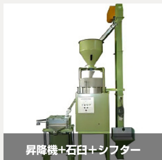
昇降機+石臼+シフター